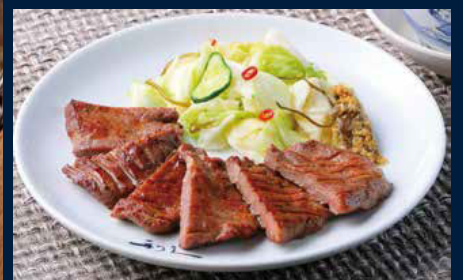
※写真はコンペ賞品一例です(調理例)